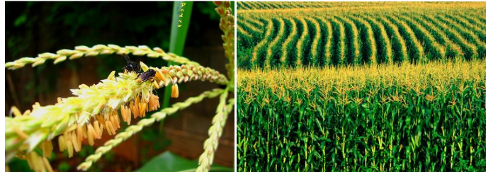
Terceira Etapa – Era pentecostal (palha), Era da Noiva (grão) formado dentro da palha.