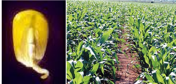
Segunda Etapa – Floresceu com Wesley