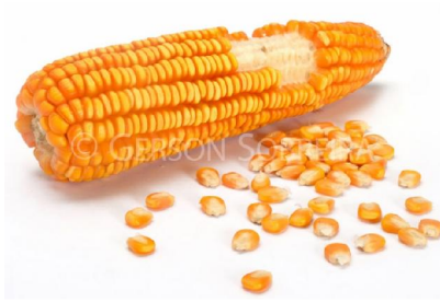
Primeira etapa – Germinou e cresceu com Lutero,